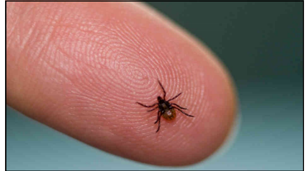
Las garrapatas negras

Pacientes que son tratados con antibióticos en la etapa temprana de esta infección generalmente se recuperan rápidamente.